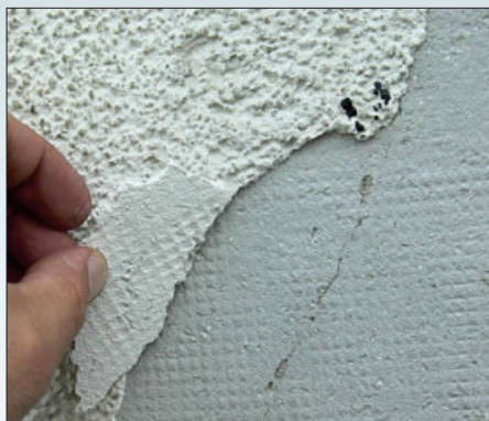
Отслаивание декоративного покрытия вследствие неправильного выбора грунтовочного состава. Грунтовка не применялась или использовалась неподходящая для данного вида покрытий

Температура ниже +5 °C недопустима еще по одной важной причине. В минеральных (сейчас они все практически модифицированы), а уж тем более в полимерных штукатурках, каждый используемый полимер имеет свою минимальную температуру пленкообразования, которая,