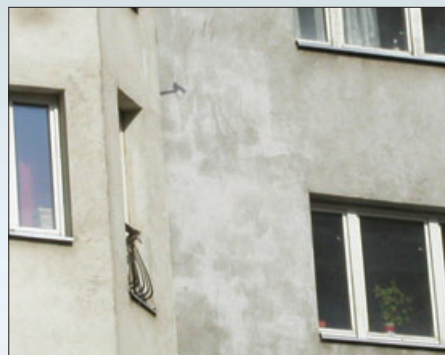
Намокание лакокрасочного покрытия вследствие применения лакокрасочных материалов с высоким водопоглощением с последующим появлением белесых пятен на поверхности из-за выхода из армированного слоя солей (выщелачивание)