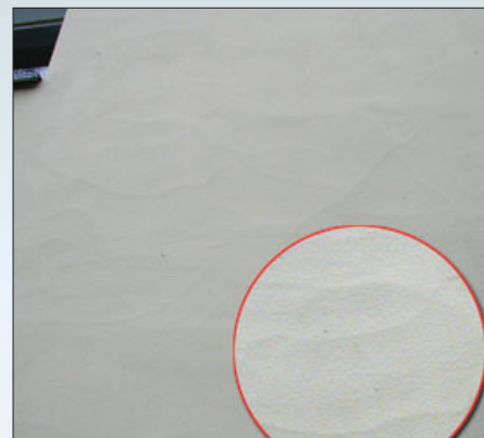
Шпаклевание поверхности произведено неподходящими материалами с большей плотностью, что вызвало растрескивание и вспучивание декоративных отделочных слоев