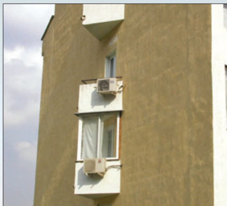
Дефекты внешнего вида из-за больших перепадов толщины теплоизоляционных плит, неравномерного нанесения и засушенных стыков штукатурного покрытия

Внешняя поверхность плитки, выполненная с большими углублениями, и соответственно, с возможностью водонакопления, приведет в процессе эксплуатации