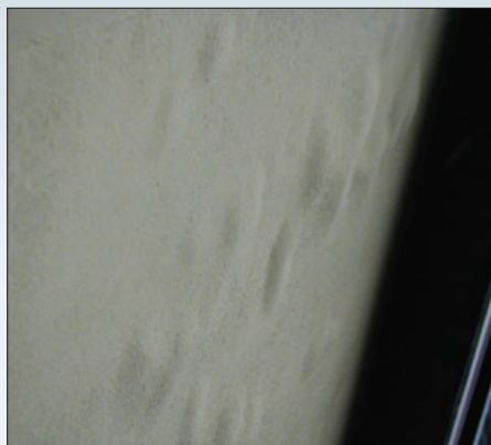
Вздутие декоративного покрытия вследствие несоблюдения технологии нанесения и/или применения несогласованных материалов

Материалы с высокой гигроскопичностью, применяемые в теплоизоляционных системах, приводят к быстрому и ненормированному накоплению влаги не только на поверхности декоративного покрытия, но и в толще армированного слоя. Такое состояние материалов при резких, особенно суточных, перепадах температуры наружного воздуха приводит к быстрым и множественным разрушениям декоративно-защитного и армированного покрытий в виде распространения хаотично расположенных трещин и локальных разрушений. Особенно сильно такие разрушения проявляются в местах, подверженных повышенным воздействиям водных нагрузок, таких как цокольные части здания, зоны неостекленных балконов, примыкания к выступающим декоративным элементам.