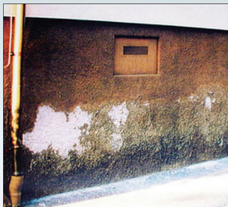
При разработке цветового решения был выбран недопустимый оттенок покрытия (слишком темный цвет и слишком контрастная расцветка)

Применение грунтовочных материалов, не окрашенных в массу при нанесении декоративных штукатурок с бороздчатой фактурой, которые в дальнейшем не подлежат дополнительному окрашиванию, может приводить к появлению просветов через штукатурное покрытие армированного слоя. Такие поверхности при определенном