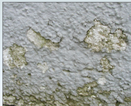
Отслаивание лакокрасочного покрытия вследствие применения окрасочного материала, не предназначенного для данного вида системы. Например, применение акриловых лакокрасочных материалов на системах теплоизоляции с минераловатной плитой