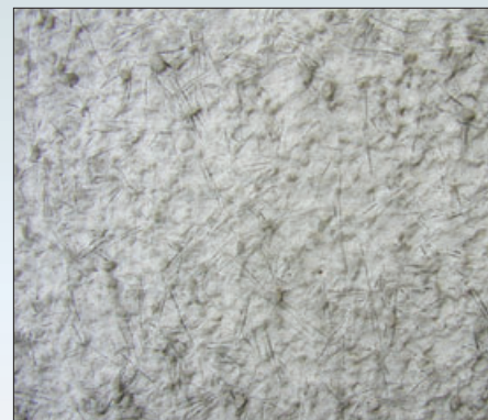
Дефекты лакокрасочного покрытия вследствие нарушения технологии нанесения. Окраска декоративного покрытия производилась при температурах окружающей среды и основания ниже +5 °C