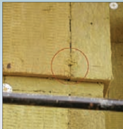
Дюбель был установлен в место приклеивания теплоизоляционной плиты в угловой зоне без соответствующего закрепления в основании.