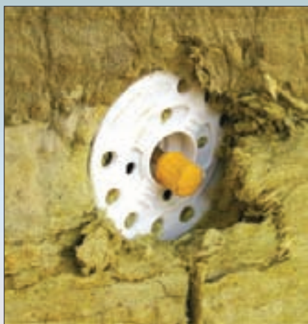
Нарушение технологии и несоблюдение технологических требований привело к установке дюбелей с перекосом и излишним заглублением.