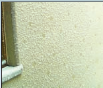
Произведен неправильный выбор и монтаж дюбелей — применялись дюбели с неизолированным металлическим сердечником, что привело к появлению мокрых пятен на декоративном слое (в местах установки дюбелей), а в дальнейшем загрязнению, моканию и отслаиванию в этих местах.