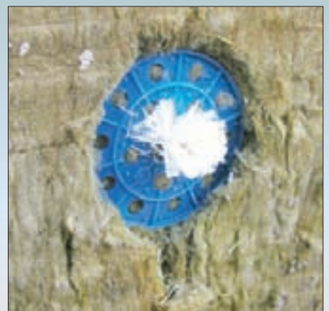
При монтаже использовались сверла не соответствующего диаметра, что привело к разрушению и неправильной установке дюбелей со стеклопластиковыми сердечниками.