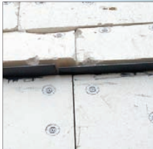
Применение дюбелей, полностью выполненных из металла, приведет к локальным промерзаниям и разрушениям декоративно-защитного слоя.

ких испытаний приводит к значительным проблемам на стадии подготовки к устройству армирующего слоя, когда выясняется, что применяемые дюбели не обеспечивают необходимых показателей по надежности крепления утеплителя, а зачастую просто выдергиваются из стены (именно поэтому проверка дюбелей на правильность установки называется на сленге инженеров-технологов «сбором грибов»). Понятно, что в этих случаях и у подрядчика, и у заказчика возникают серьезные проблемы не только экономического характера, но и по срокам производства работ.