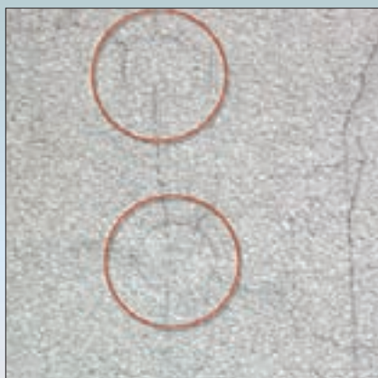
Использование дюбелей с высоким коэффициентом теплопроводности привело к неравномерному распределению нагрузок декоративно-армирующего слоя в своей реакции на гидротермические воздействия.