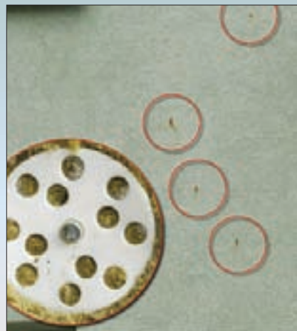
Пятна ржавчины вызваны коррозией элементов механического крепления с изолированными сердечниками.

Применение дюбелей, которые изготовлены не из нержавеющей или оцинкованной стали и/или не имеют дополнительного органического покрытия, с металлическим распорным элементом при дальнейшей эксплуатации приводит к выходу на поверхность декоративно-защитного слоя продуктов коррозии. Проблемы такого рода возникают из-за того, что дюбель является элементом, который проходит сквозь всю теплоизоляционную систему, и конденсация влаги в первую очередь происходит на гильзе дюбеля, а особенно на металлическом распорном элементе. При этом зачастую не учитывается повышенная агрессивная среда, создаваемая ми-