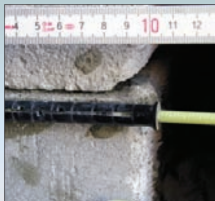
Монтаж теплоизоляционной системы производился на здании с большими отклонениями поверхности от вертикали. Дополнительный расчет и увеличение длины дюбелей не производилось.