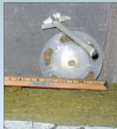
При монтаже использовались дюбели, не природные и/или не предназначенные для использования в фасадных системах теплоизоляции. Например, дюбели из полипропилена — материала, который обладает низкой морозостойкостью, повышенной способностью к релаксации (то есть снижением во времени силы распора дюбеля в основании — и как следствие снижением силы трения).